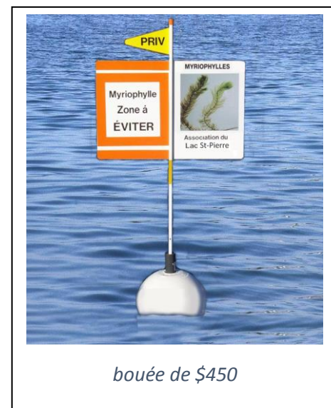
bouée de $450

Contribuer $1,000: vous obtenez 10 années d'adhésion transférable + bouée $450 (qté 1) + bouées $30 (qté 7)